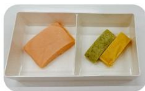
ソフト食 (鮭塩焼き・卵焼き・ブロッコリー)