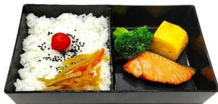
ごはん・きんぴら 鮭塩焼き・卵焼き・ブロッコリー

ニチワブースにてニュークックチルのご試食を御用意しております。 この機会に是非、 スチコン式再加熱機器 による料理の仕上がりをご確認下さい。